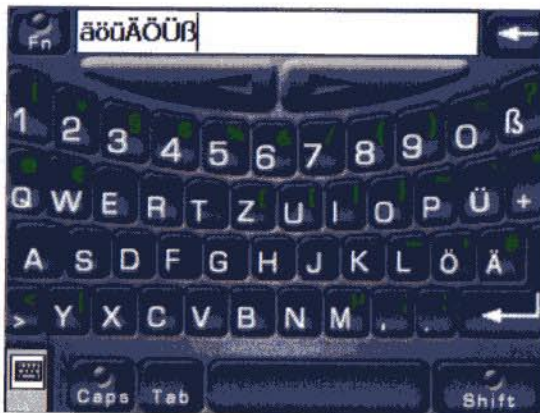
Das Programm Spb Full Screen Keyboard zeigt eine Bildschirmtastatur mit schön großen Tasten an

Wollen Sie für kleinere Texteingaben weiterhin die normale Bildschirmtastatur verwenden oder die Schrifterkennung? Und nur für längere Eingaben das Full Screen Keyboard? Kein Problem: Lassen Sie einfach das Eingabemethoden-Menü unverändert und legen Sie mit dem Einstellungsprogramm »Tasten« das Full Screen Keyboard auf eine der Hardware-Tasten. So können Sie die große Bildschirmtastatur jederzeit aufrufen. Diese Vorgehensweise ist sehr zu empfehlen. Denn auch wenn das Full Screen Keyboard sich mit den meisten Standardanwendungen wie »Pocket Word« und »Notizen« verträgt, so