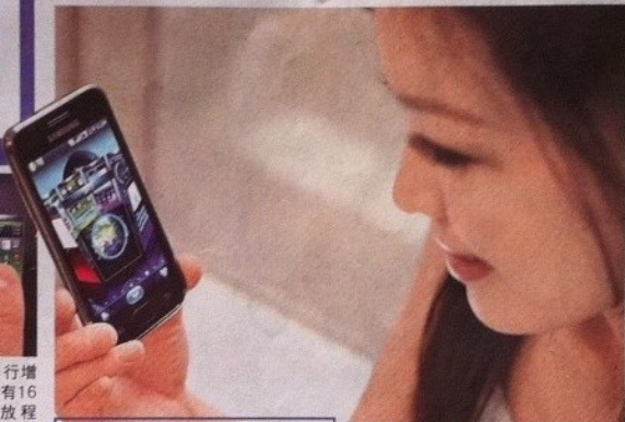
▲GPhone不只比硬體規格，操作介面更要酷炫、順暢，才有賣點。