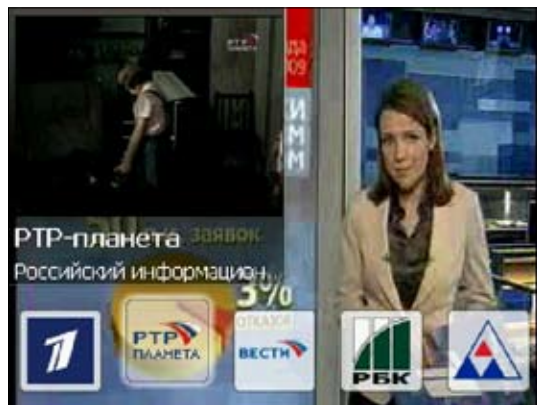
Так выглядит режим «картинка в картинке». Очень удобно при выборе телеканала, к которому хочется перейти.

И вот нужный канал найден, подходящая передача выбрана... можно переходить к просмотру. Нажмите на окно с «живой картинкой» телеканала в основном экране. Для доступа к настройкам звука и изображения достаточно коснуться экрана. Если выбрать первую иконку, то вместе с просмотром телепрограммы отобра-