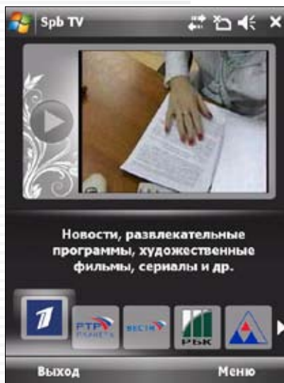
В окне предварительного просмотра показывается картинка того, что сейчас идет на выбранном канале.